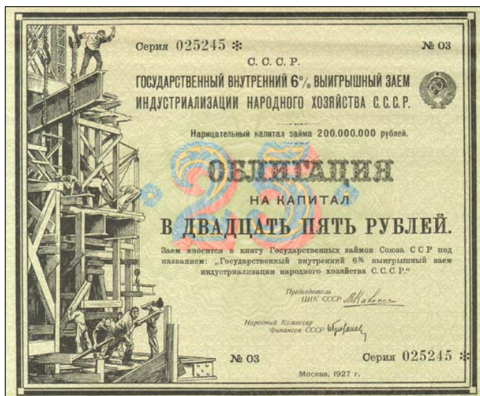
E6763 – Obligace SSSR na 6% úrok, vydaná na 25 rublů v roce 1927