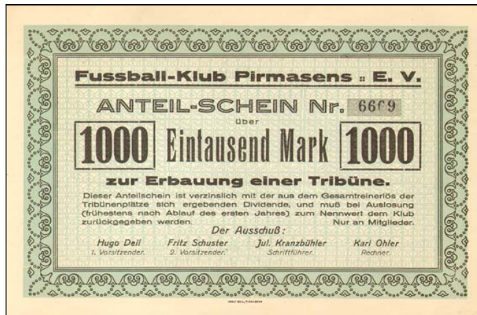
E6762 – Podílový list Fussball-Klub Pirmasens E.V. na 1.000 RM, 1920

Původní firma „Elbemühl“ zůstala i nadále v Rakousku a její akcie byly od roku 1935 kótovány na vídeňské burze. Vyčleněním českých závodů do samostatné firmy byla přerušena linie a akcii musíme považovat za rakouskou, byť s českými kořeny. Přestože není česká, jde o velmi vzácný kus, který se v aukcích často neobjevuje. Akcie byly totiž později nahrazeny za kusy v rakouských šilincích.