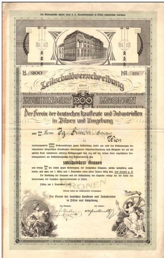
A2579 – Dluhopis Spolku německých obchodníků v Plzni, 1907