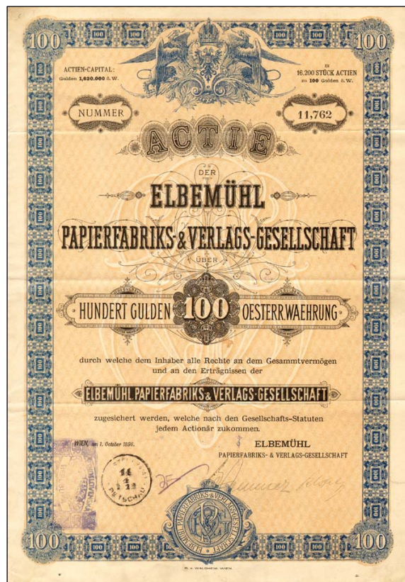
E6764 - Akcie Elbemühl Papierfabriks z roku 1896 na 100 zl.