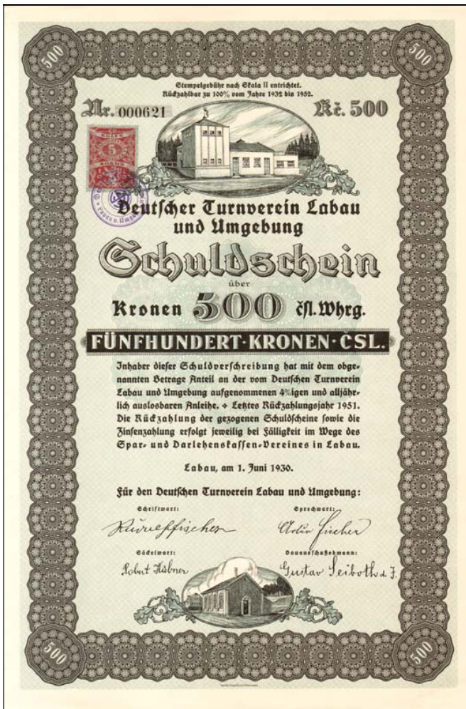
A2578 – Dluhopis Německého tělocvičného spolku v Hutí, 1930

Československá republika měla od svého vzniku problémy s národnostmi obyvatel. Zákony proto sloučili dva největší národy a vznikla jednotná národnost Československá. Maďarům, Polákům a přirozeně Němcům se to příliš nelíbilo. Další vývoj směřující k událostem roku 1938 všichni známe. V jejich důsledku došlo k událostem roku 1945, tedy odsunu nepřátelských obyvatel z republiky. Od té doby se na původní české, byť národnosti německé obyvatele zapomnělo a nebo byly hanlivě nazýváni Sudeťáci. V každé skupině je černá ovce, stejně tak jako čestný člověk, který je jen obětí doby a situace.